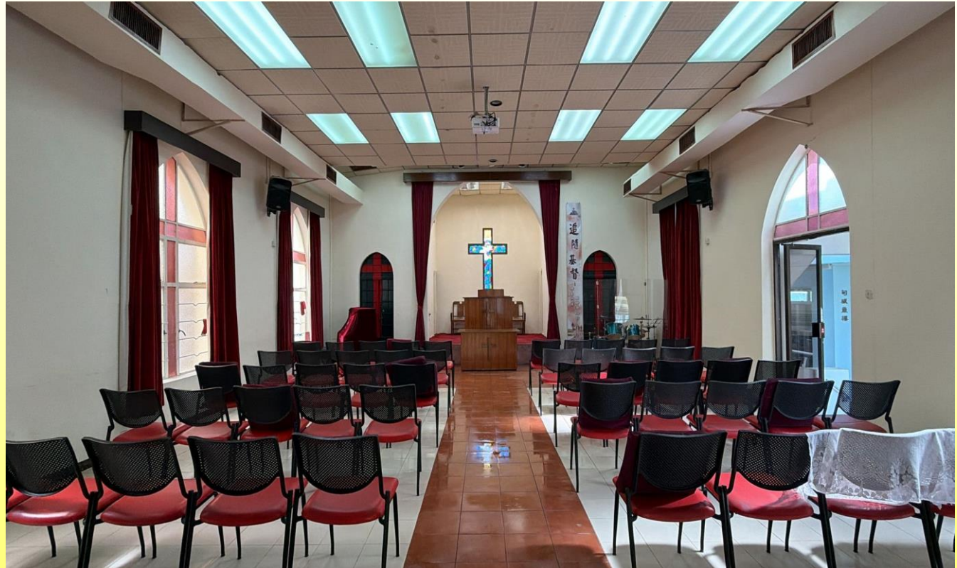
位於上層的聖堂 Sanctuary at upper level