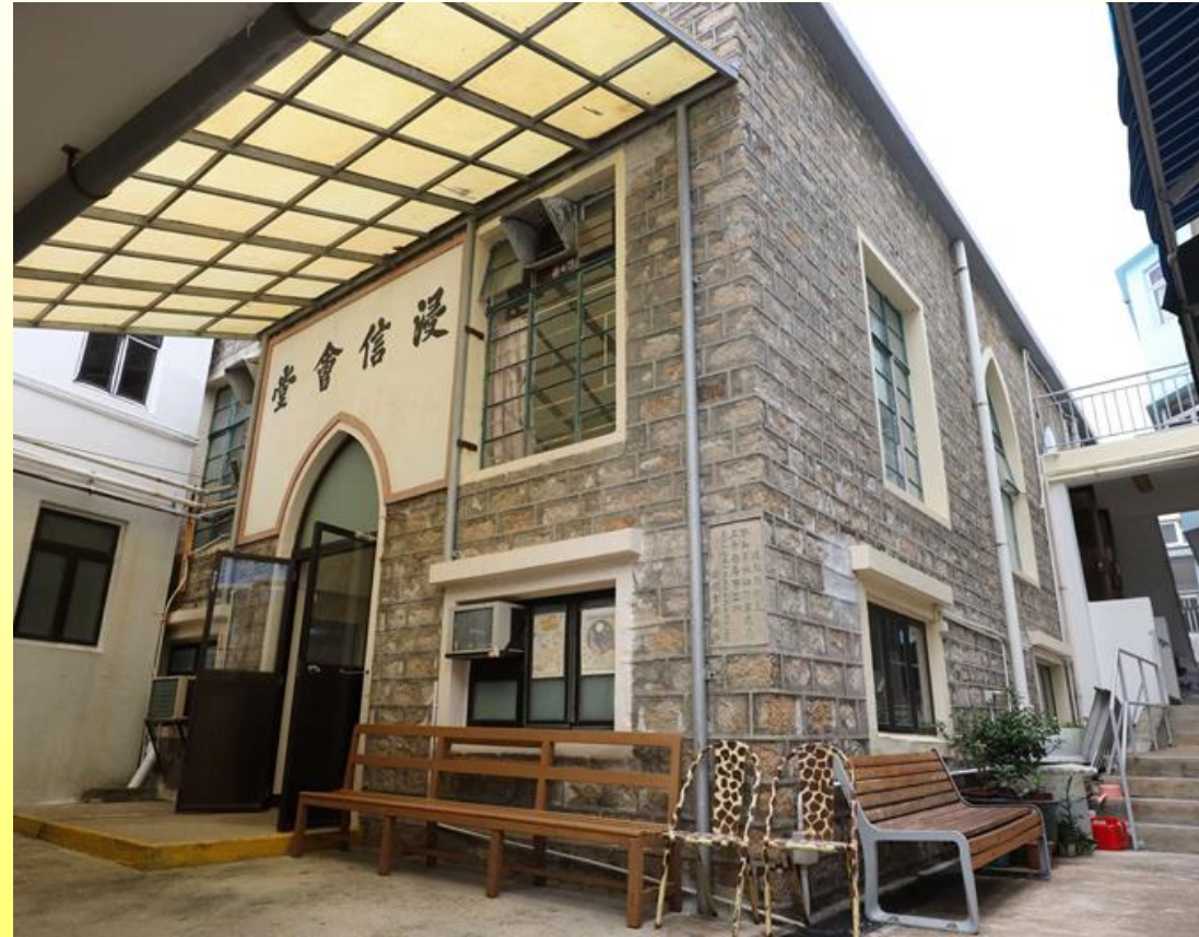
正立面和側立面 (向南)