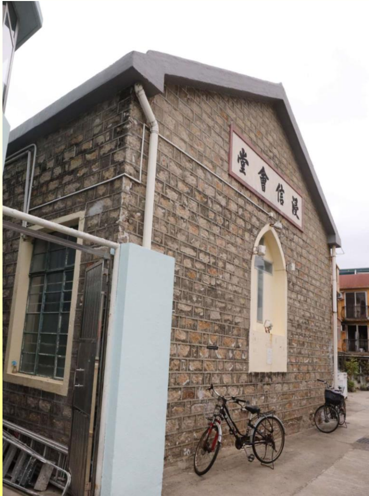
背立面 Rear elevation

新界長洲新興後街97號長洲浸信會禮堂 Chapel of Cheung Chau Baptist Church, No. 97 San Hing Back Street, Cheung Chau, New Territories